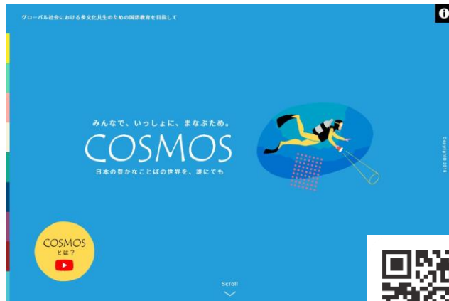
Webプラットフォーム『COSMOS』 https://cosmos.education/