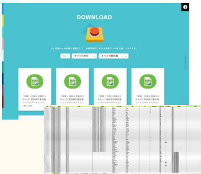
教科書別・学年別・単元別の総計275,541語シラバス