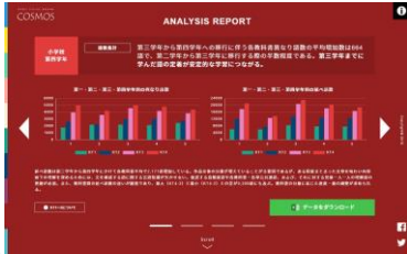
教科書分析結果 (学年別)