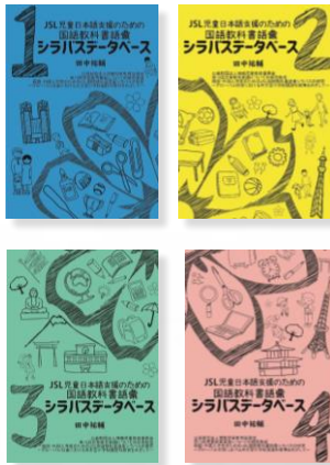
冊子版（4分冊・3,000頁） 『国語教科書語彙シラバスデータベース』

日本語を学びたい子どもたちのために 科学的手法で構築された国語学習支援データベースを無料で公開 世界26カ国に利用が広がっています